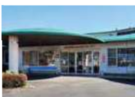
輝北ふれあいセンター