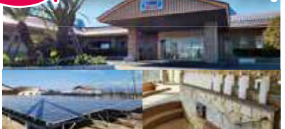
湯遊ランドあいら